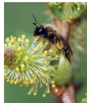
Weidensandbiene (an Mandelweide)

Manche Arten sammeln Pollen nur an einer einzigen Pflanzenart, wie die Zaunrübensandbiene nur an der Zaunrübe oder die Weidensandbiene nur an Weiden.