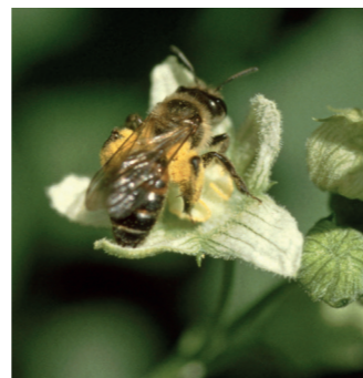
Zaunrübensandbiene (an Zaunrübenblüte)