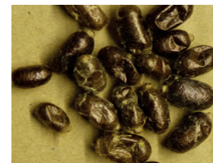
Kokons Rostrote Mauerbiene

Aus dem Ei schlüpft eine kleine Made, die sich vom Pollenvorrat ernährt. Sie wächst, häutet sich mehrmals und spinnt sich dann in einen Kokon ein. In diesem erfolgt im Laufe des Sommers die vollständige Verwandlung zur fertigen Biene. In der schützenden Hülle des Kokons überwintert die neue Biene.