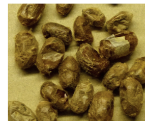
Kokons Gehörnte Mauerbiene